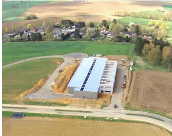
L'entreprise l'Œuf d'Or sort de terre sur le parc d'activités de la Houssaie (Andenne). Voici deux photos du chantier vu du ciel, à gauche datant de mars et à droite, datant d'avril.